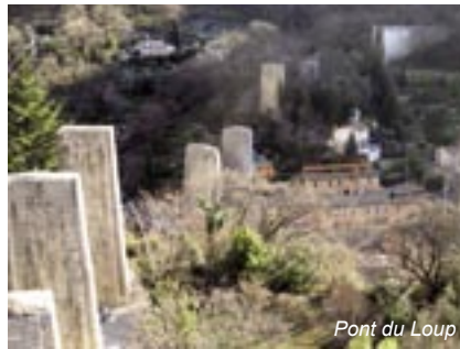
Pont du Loup

La rivière du Loup d'une longueur de 45 kilomètres prend sa source dans le massif de l'Audoubert au pied d'Andon à 1200m d'altitude et se jette dans la méditerranée à Ville neuve-Loubet.