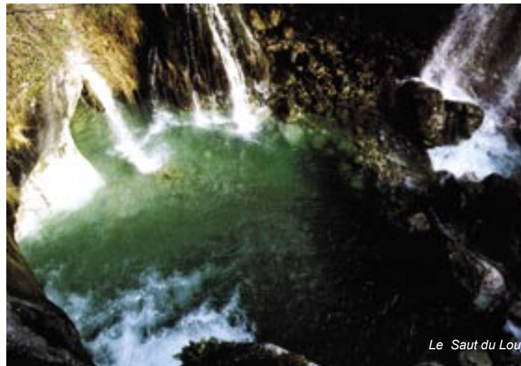
Le Saut du Loup

Un ancien sentier taillé dans la falaise passait sous la cascade pour rejoindre le village de Courmes.